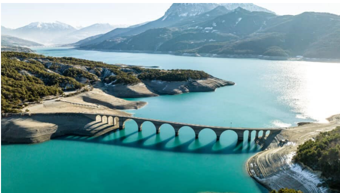
Lac de Serre-Ponçon et son barrage